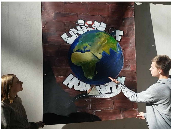
Die Kunstaktion auf der ITB

Fürknapp 1000 Jahre fanden im antiken Griechenland die Delphischen Spiele im Jahr vor den Olympischen Spielen statt. Während bei den Olympischen Spielen der kompetitive Charakter im Vordergrund stand, waren die Delphischen Spiele vor allem der emotionalen Intelligenz und der Einheit von Seele und Geist gewidmet. Zum Jubiläumsjahr der Delphischen Spiele 2018 stehen ihre Lösungsvorschläge ganz im Zeichen des gegenseitigen Verstehens anderer Kulturen. Die Ergebnisse werden zunächst am Pankower Gymnasium, das sich ganz besonders für die Wiederbelebung der Idee der Delphischen Spiele engagiert und an dieser Schule seit vielen Jahren Kunst besonders gefördert wird, ausgestellt, bevor die Plakate ihren Weg nach Delphi ebnen.